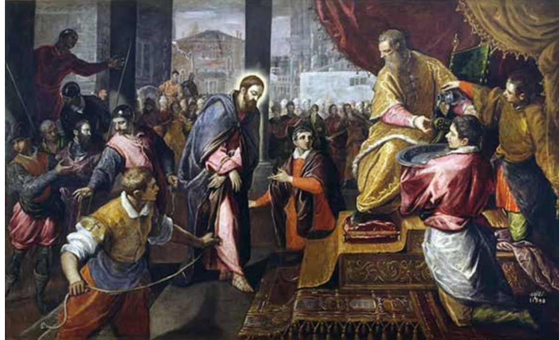
Domenico Robusti - Cristo davanti a Pilato

Sul monte degli Ulivi un uomo aspetta che i soldati vengano ad arrestarlo per condurlo al supplizio. Quale potenza soprannaturale ha fatto di lui, figlio di un falegname, un trascinatore di popolo che fa miracoli e predica l'amore e il perdono? Tre giorni dopo, la mattina di Pasqua, Pilato conduce la più inconsueta delle inchieste: un cadavere è scomparso. Scritto con lo stile incalzante di un noir, Il vangelo secondo Pilato conquista lo spettatore con una sequenza di colpi di scena. Non solo il cadavere è scomparso, addirittura circola la voce ridicola che Gesù sia vivo. Il protagonista delle apparizioni è un sosia? Dov'è nascosto il cadavere? Chi tira le fila di questo macabro gioco? Ma Gesù è davvero morto sulla croce? Pilato indaga. Il caso appare insolubile. Il Vangelo secondo Pilato, una delle opere più intriganti del grande scrittore e drammaturgo francese Eric-Emmanuel Schmitt prende avvio per trovare delle risposte e termina con delle domande. Domande profonde che non possono essere risolte. Possono solo essere raccontate. Quanta è lontana Roma dalla fastidiosa Giudea per Pilato. E quanto è strano quel che succede intorno al Messia. Messia? Gesù e Pilato, due uomini colti nel dubbio, colti dal dubbio. Alla fine gli spettatori non ricevono nessuna verità, ma i dubbi che attanagliano Gesù e Pilato alla fine saranno i loro dubbi.